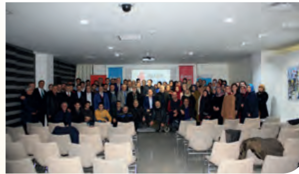
Ümraniye Kent Konseyi 2018 Yılı Genel Kurul Toplantısı

Belediyemiz; kamu kurumu niteliğindeki meslek kuruluşlarının, sendikaların, noterlerin, varsa üniversitelerin, ilgili sivil toplum örgütlerinin, siyasi partilerin, kamu kurum ve kuruluşlarının ve mahalle muhtarlarının temsilcileri ile diğer ilgililerin katılımıyla oluşan Kent Konseyinin faaliyetlerinin etkili ve verimli yürütülmesi konusunda yardım ve destek sağlamaktadır.