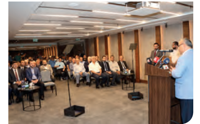
Ümraniye İş İnsanları ve Sivil Toplum Kuruluşları İstişare Toplantısı (İMES Sanayi Sitesi)