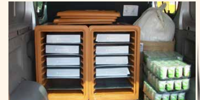
» Taziye Yemeği

İlçemiz sınırları içerisinde yakınlarını kaybeden ailelerimizin üzüntülerini paylaşmak ve acılı günlerinde yanlarında olabilmek amacıyla Aşevimizde taziye yemekleri hazırlanmaktadır. Her cenaze için et kavurma, pilav ve ayran hazırlanarak Taziye Ekip-lerince aileye teslim edilmektedir. 2013 yılı içerisinde 1423 aileye taziye yemeği hizmeti vermiş bulunmaktayız.