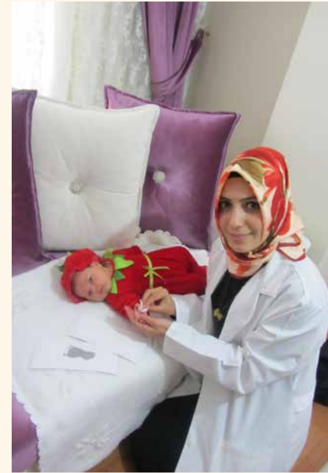
» Benim İlk İzim

Nüfus müdürlüğünden temin edilen listeler doğrultusunda, ekiplerimiz tarafından özel baskı teknikleri kullanılarak bebeklerin el - ayak izleri ve fotoğraflarının alınması ile hazırlanan çerçeve - ve hediye bakım seti ailelerimize takdim edilmektedir. Bu doğrultuda 603 aile ziyareti gerçekleştirilmiştir.