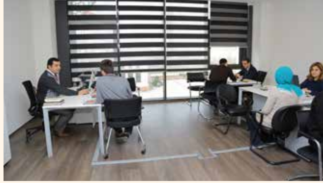
» İstihdam Merkezi Ofisi

Büromuz, hizmetlerin daha etkin ve yaygın biçimde sürdürülebilmesi için http://istihdam.umraniye.bel.tr internet sitesini faaliyete geçirmiştir. İş müracaatları bu site üzerinden yapılabilmektedir.