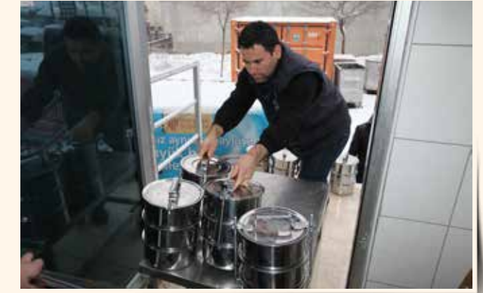
» Sıcak Yemek Dağıtımı

Yemeklerin sağlıklı ve kaliteli olmasına özen gösterilmektedir. Yemekler belirli ailelerin hastalık durumları ve istekleri göz önünde bulundurularak son derece steril bir ortamda kalori ayarına göre hazırlanmaktadır.