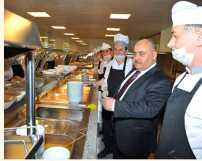
» Çiğdem Restuarant

Çiğdem Restuarantta hergün 1000 kişilik yemek hazırlanarak personelimize servis edilmektedir.