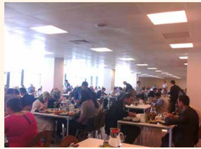
» Çiğdem Restuarant