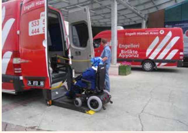
» Engelli taşıma aracı

2013 yılında 274 engelli vatandaşımıza 8.136 sefer taşıma hizmeti verilmiştir.