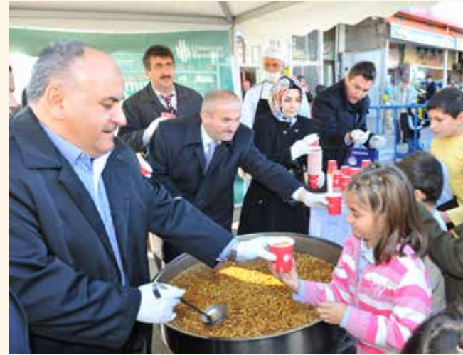
» Aşure Dağıtımı

Her yıl geleneksel olarak yapılan aşure dağıtım programında da bu yıl da 16 noktada 60.000 vatandaşımıza aşure dağıtılmıştır.