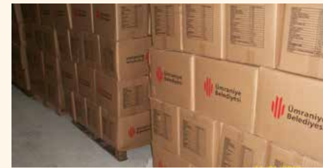
» Erzak Kolileri

Bu yıl ihtiyaç sahibi olduğu tespit edilen ailelere 20.794 koli erzak yardımı yapılmıştır.