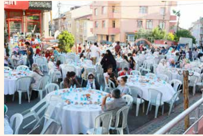
» İftar Yemeği

2013 yılı ramazan ayında toplam 190.000 kişiye iftar yemeği düzenlenmiştir.