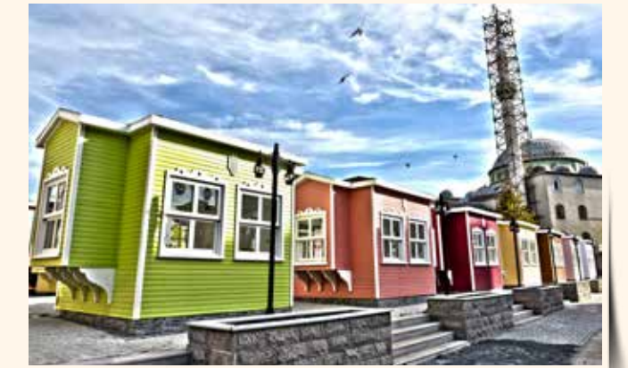
» Hanımeli Çarşısı

Ümraniye Belediyesi'nin, Sosyal Yardım Projeleri kapsamında düzenlenmiş olduğu Sondurak mevkiindeki Hanımeli Çarşısı, Ümraniyelilerin hizmetine açıldı.