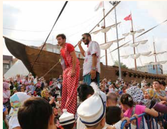
» Sünnet Şöleni