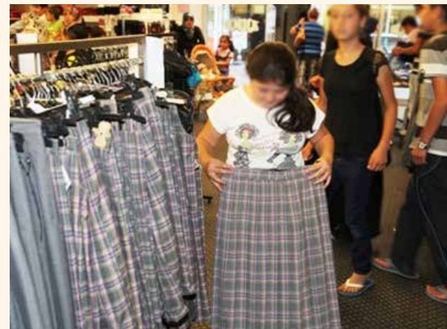
» Okul Kıyafeti Yardımı