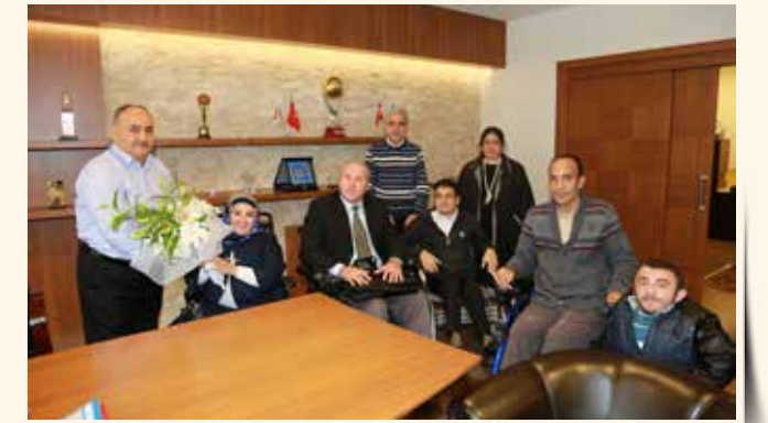
» 03.12.2013 Engelliler Konseyi Başkanımızı Ziyaret Etti.