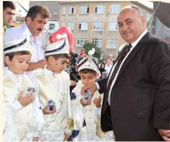
» Sünnet Şöleni

2013 yılında belediyemize müracaat eden 1.768 çocuğun sünnet kıyafetleri alınmış, sünnetleri yapılmıştır.