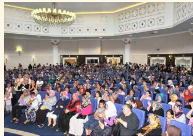
» Giyim Yardımı