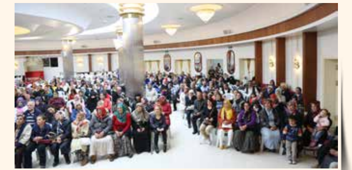
» Nakit Yardımı

2013 yılında 1.265 kişiye toplam 1.133.014 TL nakit yardımı yapılmıştır.